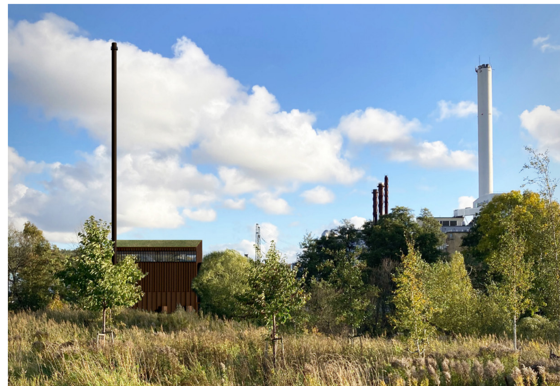
Perspektivbild från Sävån